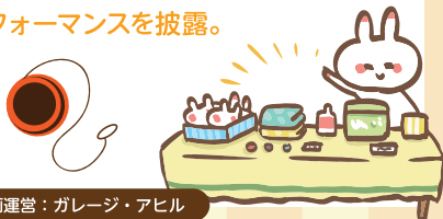
企画運営: ガレージ・アヒル

ハンドメイドクリエイターのオリジナル作品が並ぶ超レアなエリア。会場奥のステージではヨーヨー世界チャンピオンが来場し、素晴らしいパフォーマンスを披露。