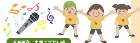
企画運営: 小牧にぎわい隊

キッズダンス、和太鼓、地元アーティストによるパフォーマンスなど、さまざまなジャンルのステージが繰り広げられます。今年は地元の皆さんが多数出演しますよ!