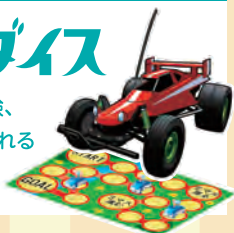
企画運営: フリースタイル

人気のナーフやラジコン体験、体感ゲームなど、時も歳も忘れるアクティブエリアです。